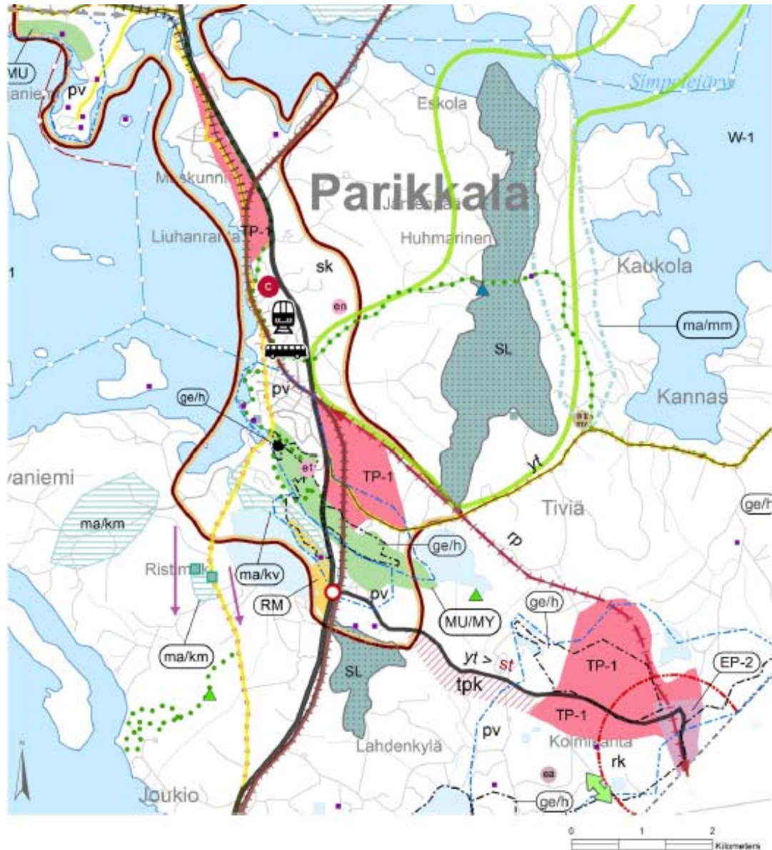
Kuva 1. Ote voimassa olevasta maakuntakaavasta

Maakuntakaavaan on osoitettu myös maakunnallisesti arvokas harjualue ge/h, joka on päällekkäinen TP-1 –alueen kanssa. Maakuntakaava ei ota kantaa niiden yhteensovittamiseksi, joten yhteensovittaminen tapahtuu tarkemmassa suunnittelussa ja osayleiskaavoituksessa