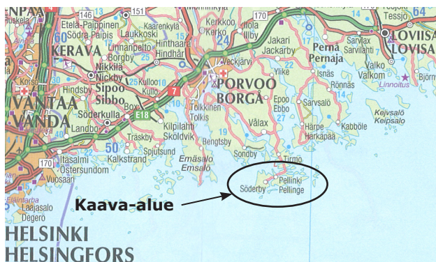
Kuva 1. Kaava-alueen sijainti Figur 1. Planområdets läge

Kaava-alue sijaitsee Porvoossa, Porvoon keskustasta noin 22 km kaakkoon. Suunnittelualueen pinta-ala merialueet mukaan lukien on noin 250 km 2 . Alueeseen kuuluu Pellingin ja Sundön kylät sekä osia kylistä Kalax, Kuris ja Jakari.